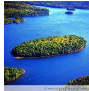
Partridge Island, Kanada

Partridge Island, Nova Scotia, Kanada, 80.000 qm, 275.000 CAD (ca. 206.000 Euro)