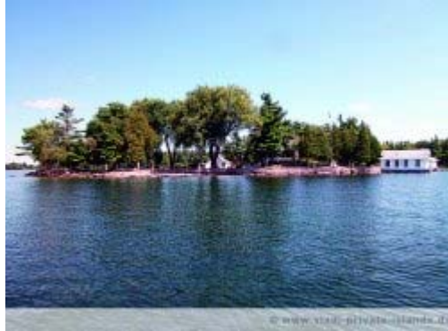
Canary Island, USA