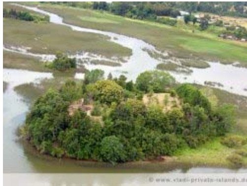
Isla Mongon, Chile