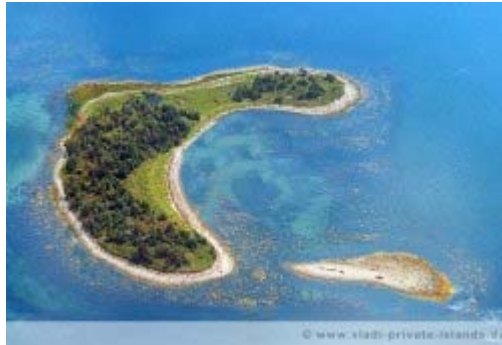
Raspberry Island, Kanada