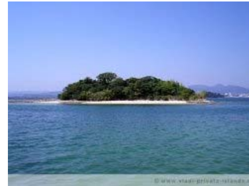
Komariyama Island, Japan

Komariyama Island, Bay of Shirahama, Japan, 3.384 qm, 876.000 USD (ca. 655.000 Euro)