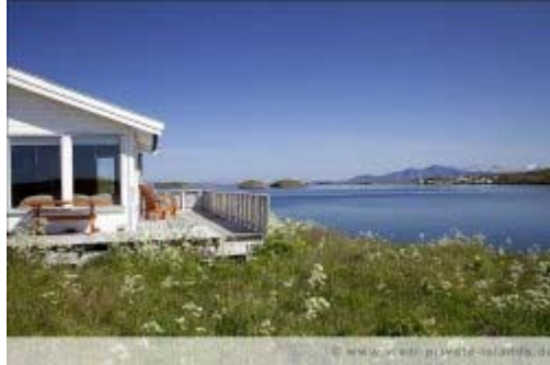
Løksøya Island, Norwegen