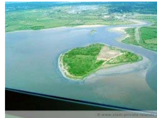
Quay Island, Irland

Quay Island, Bunratty, Co. Clare, Irland, rd. 97.100 qm, 400.000 Euro