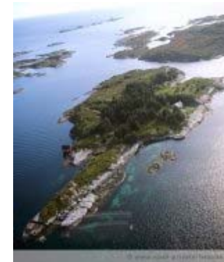
Lille Ramsø, Norwegen

Lille Ramsø and Reipholmen, Nähe Kristiansund, Norwegen, rd. 69.790 qm, 1.350.000 Euro.