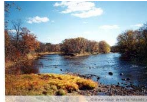
Naomi Island, USA

Naomi Island, New York State, USA, rd. 20.000 qm, 133.000 USD (ca. 99.000 Euro)