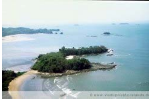
Buena Vista, Panama