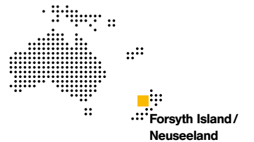
Forsyth Island / Neuseeland

syth ist perfekt für Hochzeiten und Flitterwochen. Die Gäste können wählen zwischen Vollpension oder Selbstversorgung, wobei Küche und Keller bekannt sind für den vor Ort gefangenen Fisch und exzellente Weine. Die Insel ist auch bestens geeignet für Aktivurlauber, die Delfine beobachten oder Gipfel erklimmen wollen. Zu haben ist Forsyth ab 1000 Euro die Nacht für bis zu acht Gäste.