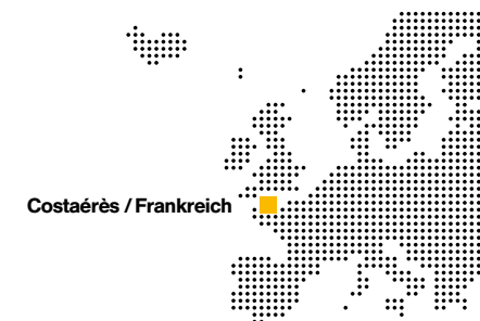
Costaérès / Frankreich