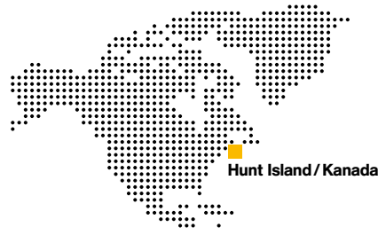
Hunt Island / Kanada

in kanadischen Seen bis zur Küste Afrikas, von der Bretagne bis in den Südpazifik. Manche Inseln sind in zwei Minuten umrundet, andere bieten kilometerlange Wanderwege. Manche verzaubern mit ihren bunten Wäldern, andere mit türkisfarbenem Meer. Alle eint das Versprechen, dass man sich nirgendwo auf der Welt besser erholt.