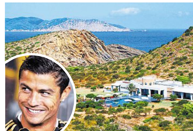
Ronaldos Volltreffer: Tagomago vor der Küste Ibizas

Vladi Private Islands in Hamburg, ☎ 0049/40/46 000 740, www.vladi-private-islands.de Online-Katalog: http://island-traveler.vladi.de